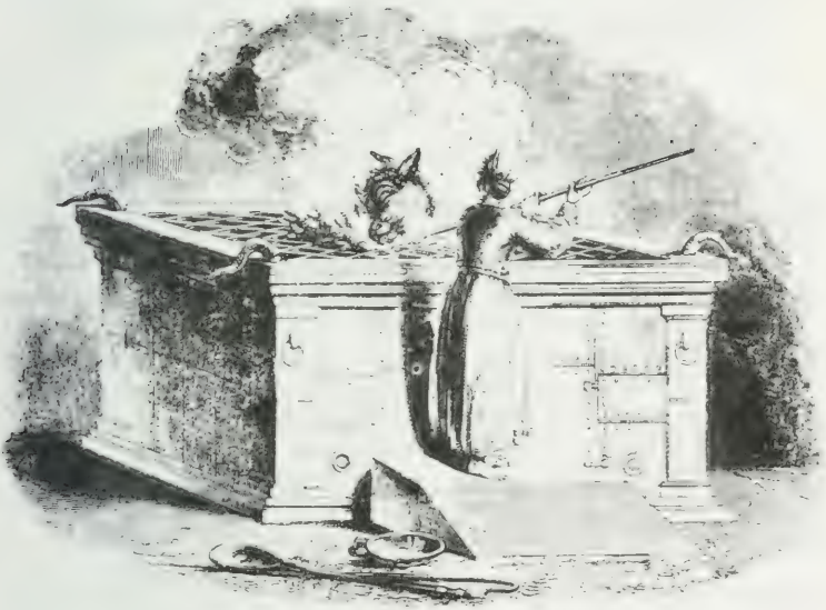
THE BRAZEN ALTAR, FOR BURNT OFFERINGS.